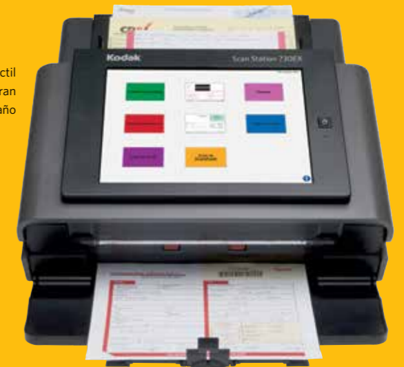
Pantalla táctil de gran tamaño

Combine la nueva pantalla táctil brillante y de fácil navegación, los controles de usuario intuitivos y la funcionalidad controlada por el administrador para obtener una experiencia de usuario con menor cantidad de errores y un mejor rendimiento, sin la distracción de un ordenador independiente. Además, el funcionamiento silencioso del escáner Scan Station hace que sea adecuado para el entorno de trabajo en oficinas.