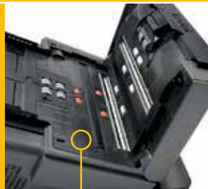
Diseño de máxima calidad

PROCESOS SIMPLIFICADOS MEJORA DE LA COMUNICACIÓN MAYOR PRODUCTIVIDAD