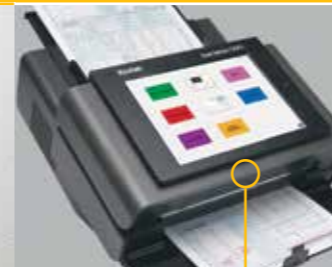
Mejoras en el manejo del papel